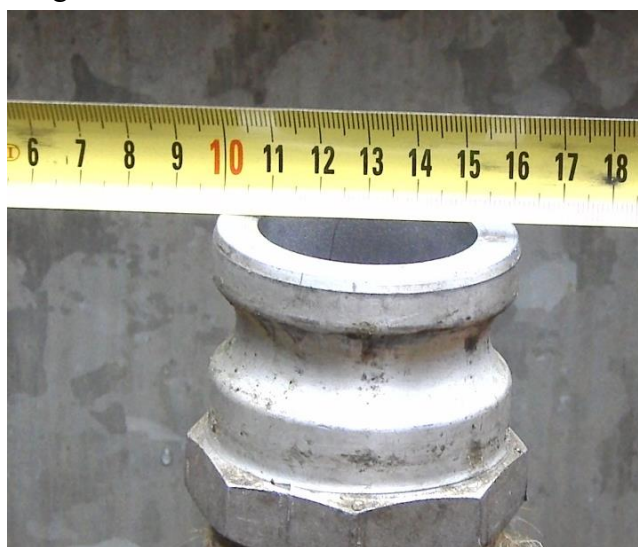
1. attēls. Tvertnes uzpildīšanas uzgali.

2.1. PASŪTĪTĀJA ēkas teritorijā Bezdēlīgu ielā 3, Rīgā, izvietotais degvielas rezervuārs (reģistrācijas numurs bīstamo iekārtu reģistrā 1RB023079), kurā jāiepilda piegādātā degviela, ir aprīkots ar degvielas uzpildīšanas cauruļvada "somu tipa" 2" uzgali (skat. 1. attēlu). PIEGĀDĀTĀJA degvielas piegādes tvertnei ir jābūt aprīkotai ar iepildīšanas cauruļvadu vai pārejas elementiem, kas ir savietojami ar PASŪTĪTĀJA rezervuāra iepildīšanas cauruļvada uzgali.