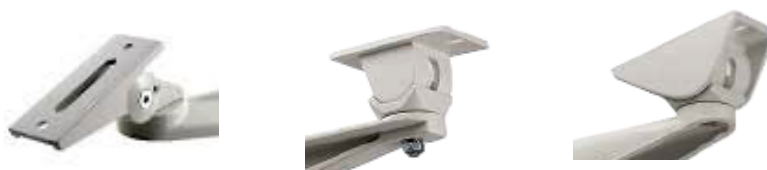
1. ilustratīvais attēls. Stacionāro videokameru kronšteinu gala elementu piemēri.